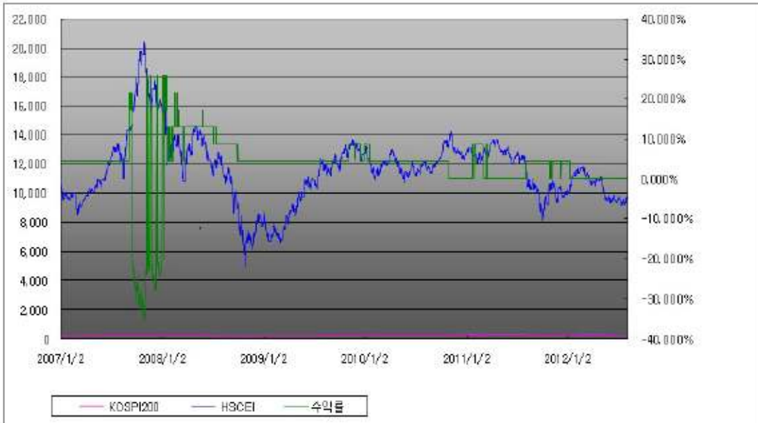
부자 제3081회 수익률 모의테스트