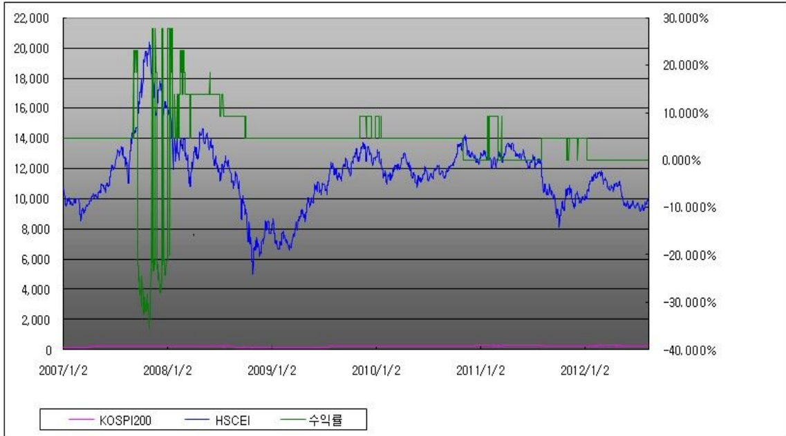
부자 제3095회 수익률 모의테스트