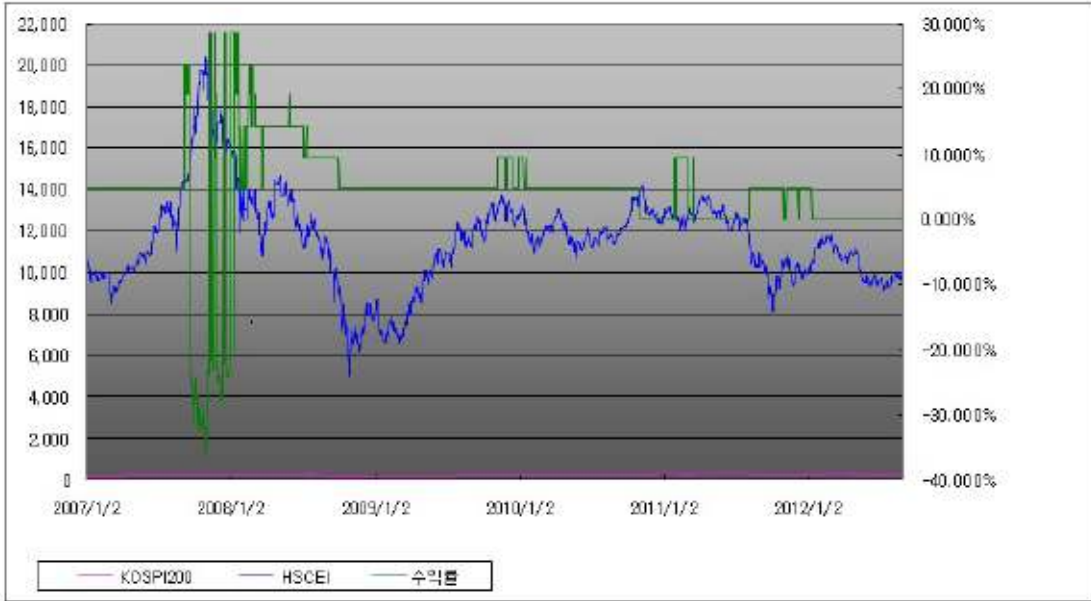
부자 제3116회 수익률 모의테스트