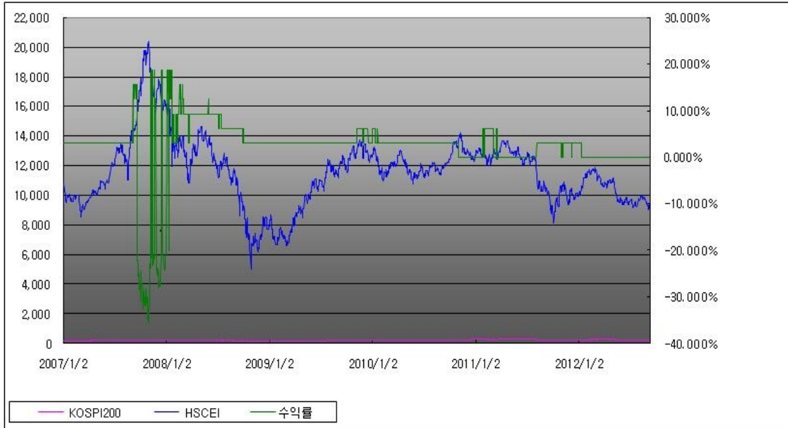
아임유 제3156회 수익률 모의테스트