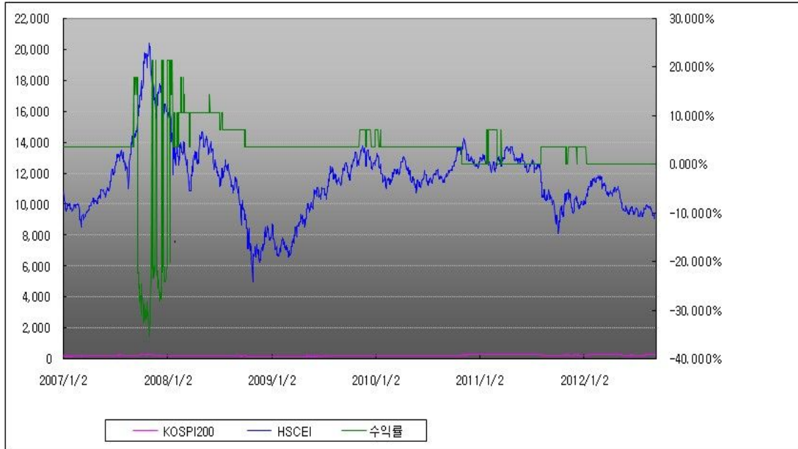
아임유 제3157회 수익률 모의테스트