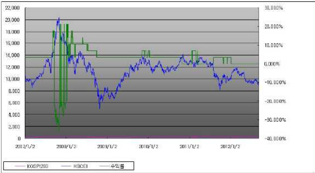
아임유 제3162회 수익률 모의테스트