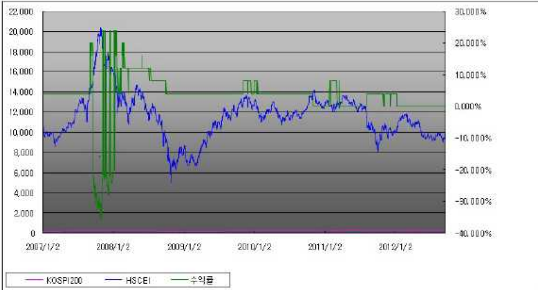
아임유 제3172회 수익률 모의테스트