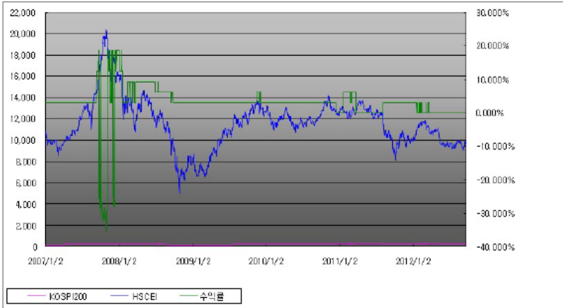
아임유 제3177회 수익률 모의테스트