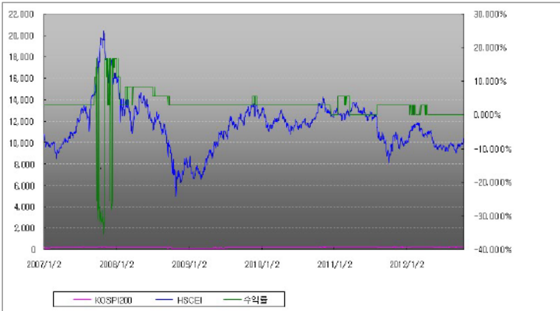
아임유 제3242회 수익률 모의테스트