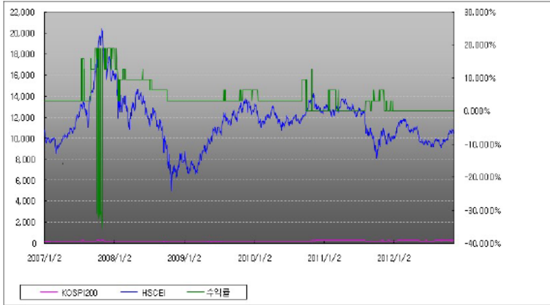
아임유 제3315회 수익률 모의테스트