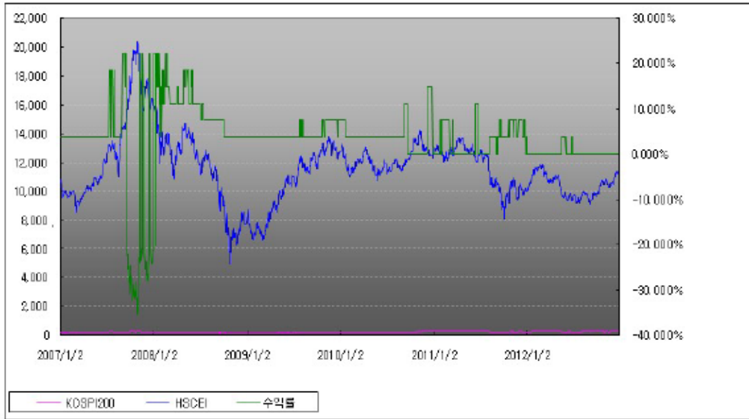
아임유 제3425회 수익률 모의테스트