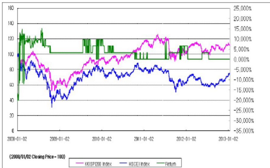
아임유 제3477회 수익률 모의테스트