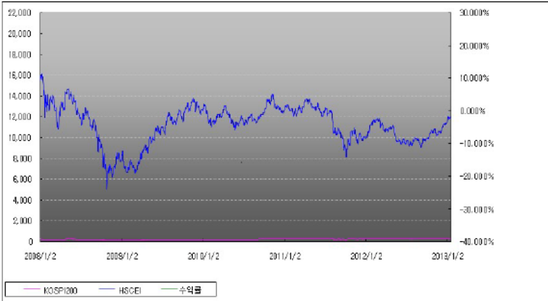
아임유 제3483회 수익률 모의테스트