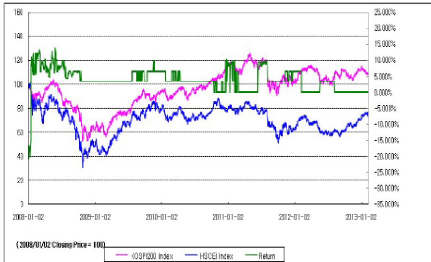
아임유 제3538회 수익률 모의테스트