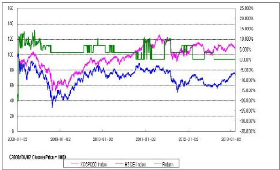
아임유 제3547회 수익률 모의테스트