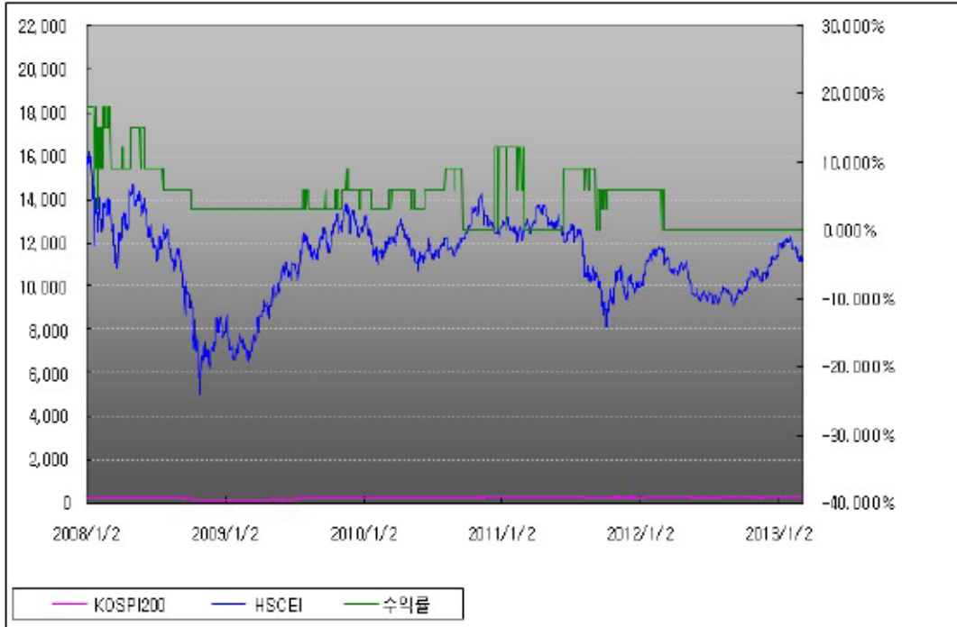
아임유 제3593회 수익률 모의테스트