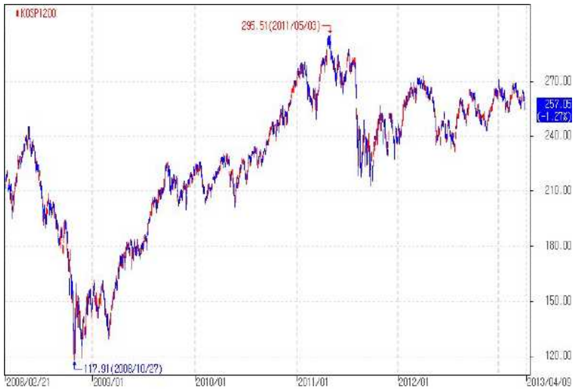
아임유 제3676회 KOSPI200 가격추이