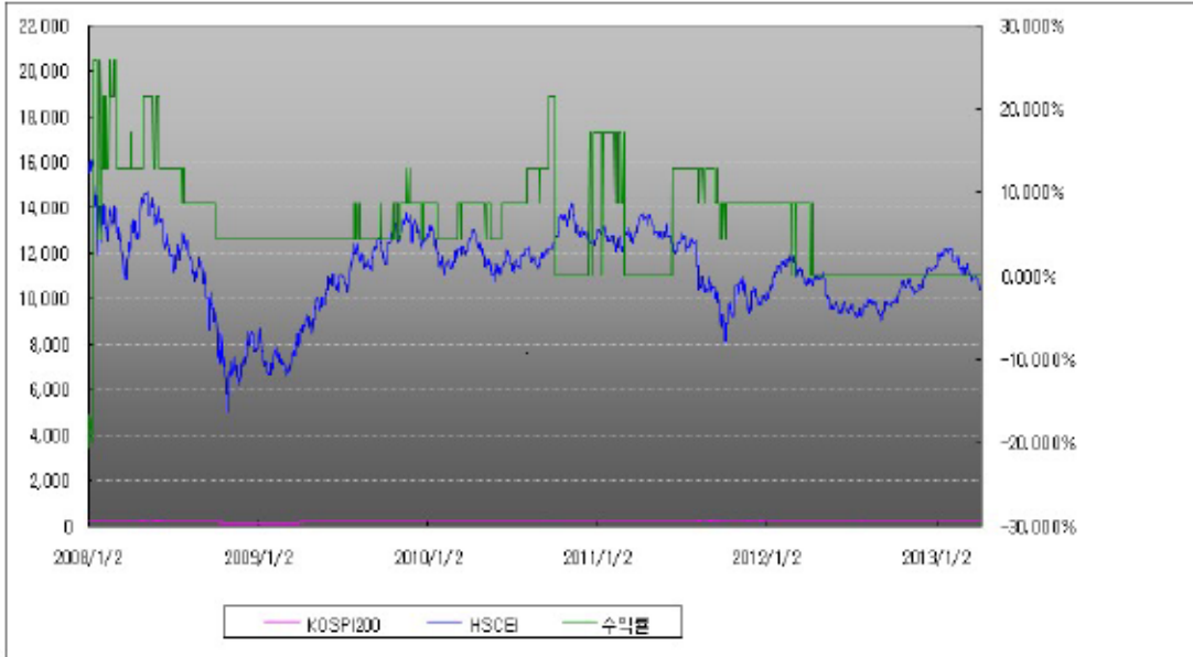
아임유 제3679회 수익률 모의테스트