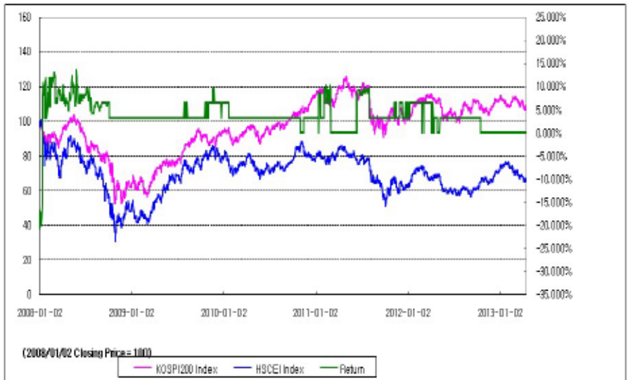
아임유 제3695회 수익률 모의테스트