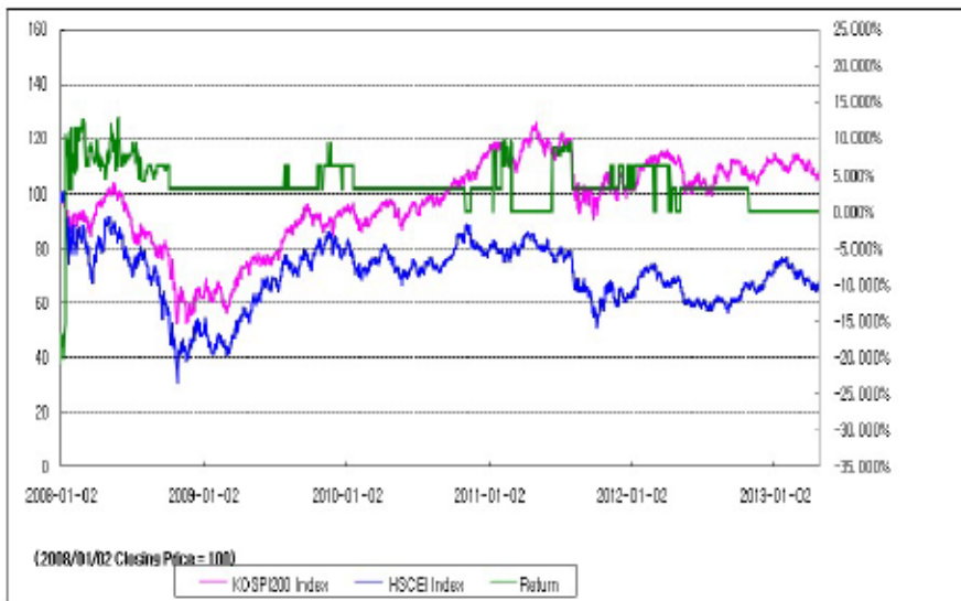
아임유 제3720회 수익률 모의테스트