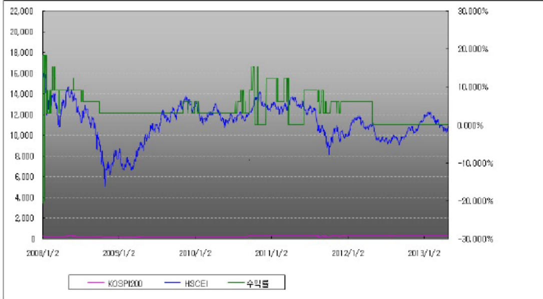
아임유 제3730회 수익률 모의테스트