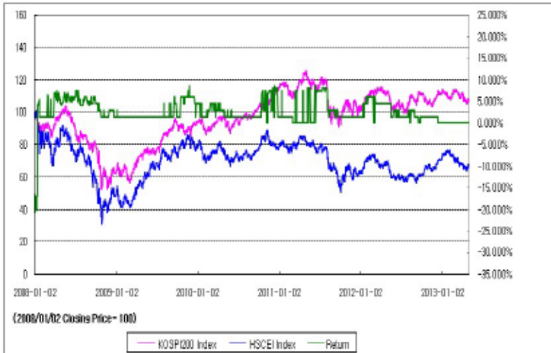
아임유 제3733회 수익률 모의테스트