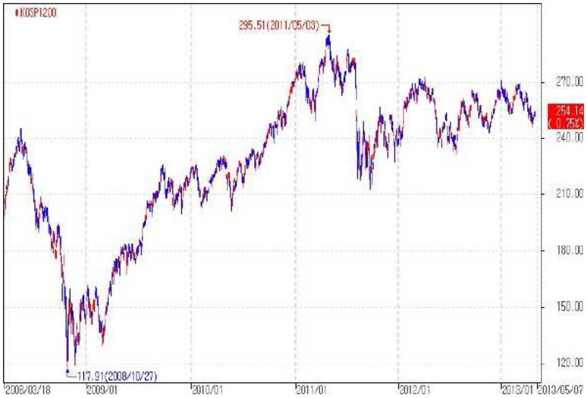
아임유 제3739회 KOSPI200 가격추이