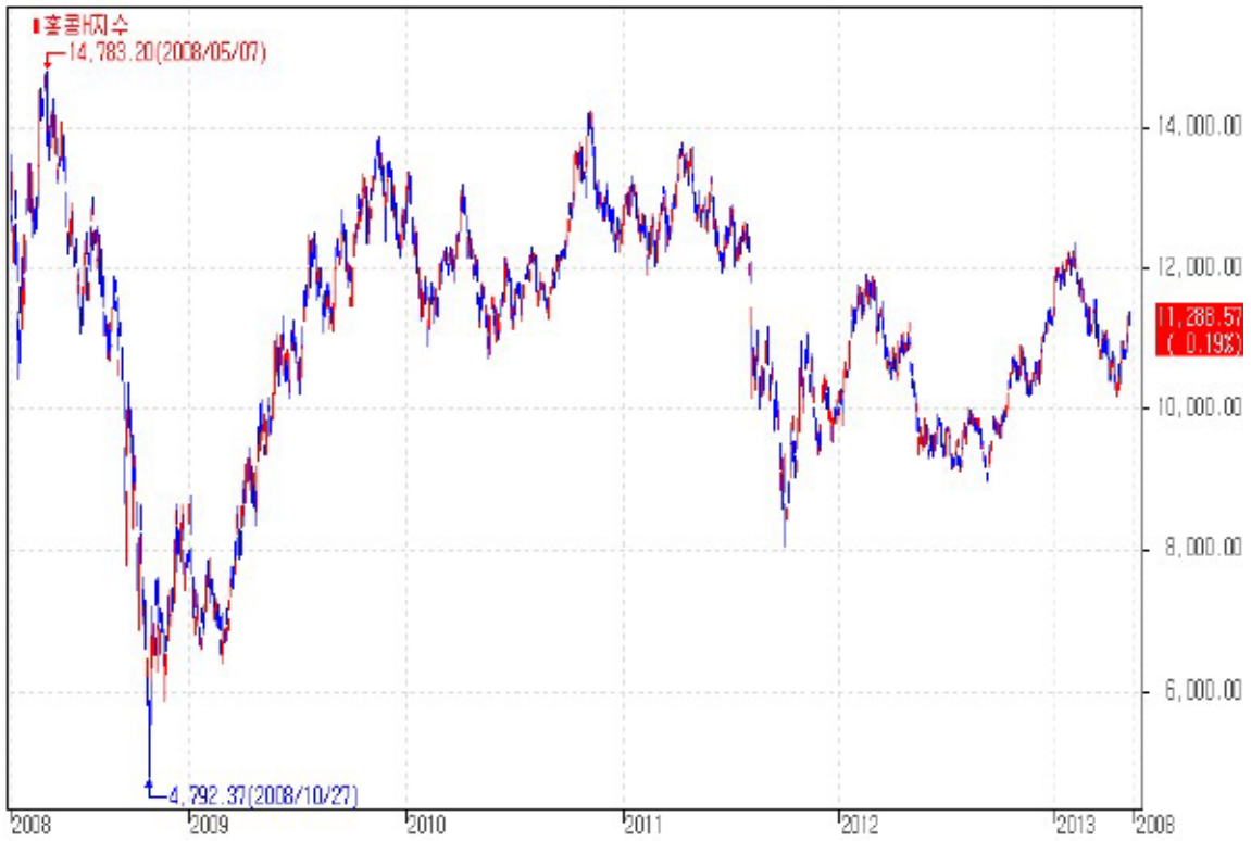
아임유 제3763회 HSCEI 가격추이

주1) 기초자산의 가격변동 추이와 파생결합증권의 수익구조는 상품의 구조별로 상이할 수 있습니다.