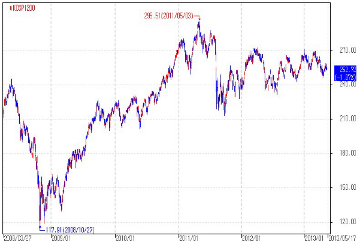
아임유 제3763회 KOSPI200 가격추이