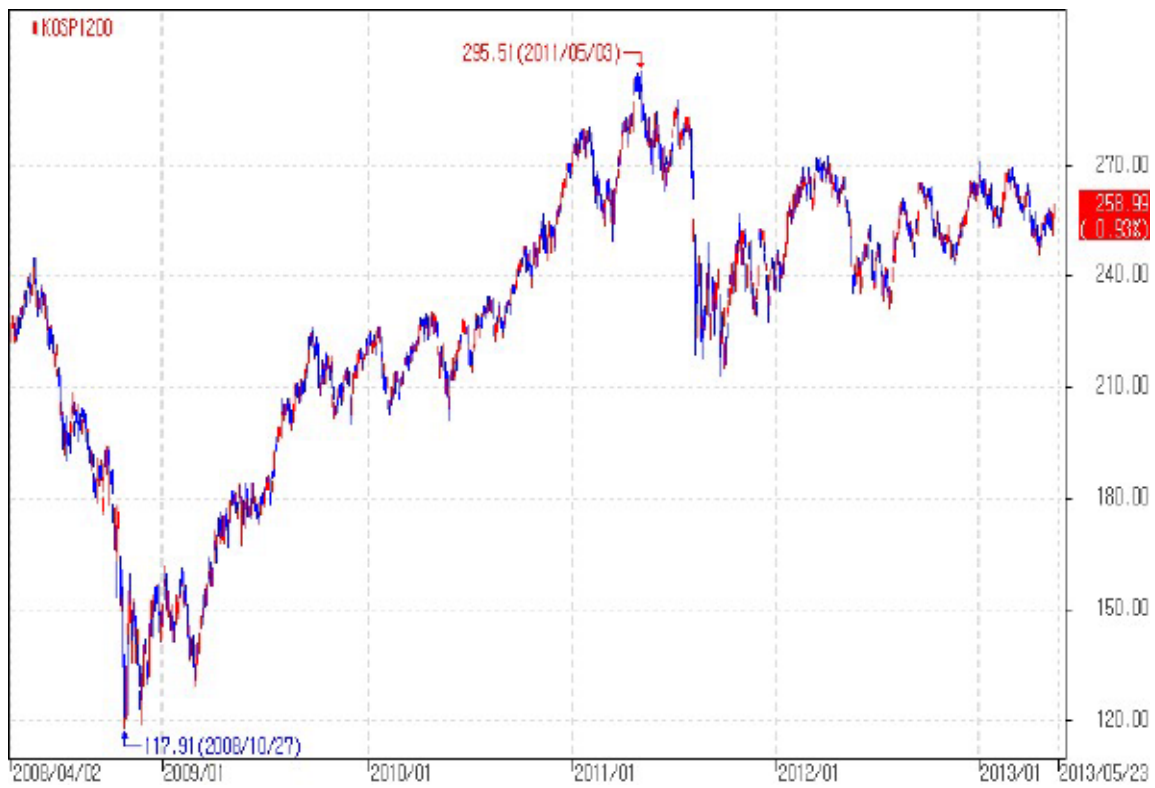
아임유 제3779회 KOSPI200 가격추이