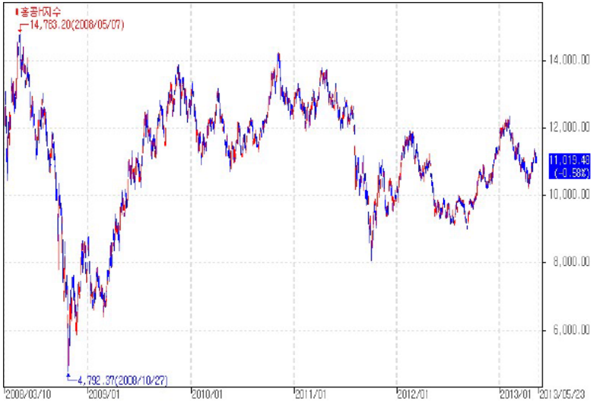
아임유 제3779회 HSCEI 가격추이

주1) 기초자산의 가격변동 추이와 파생결합증권의 수익구조는 상품의 구조별로 상이할 수 있습니다.