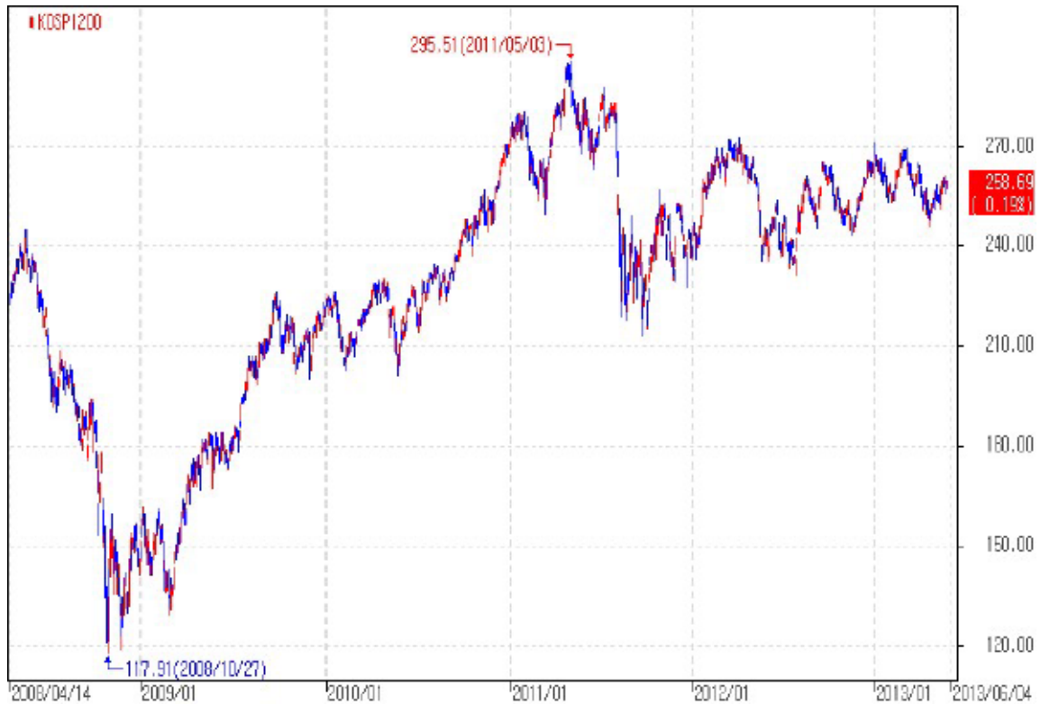
아임유 제3803회 KOSPI200 가격추이