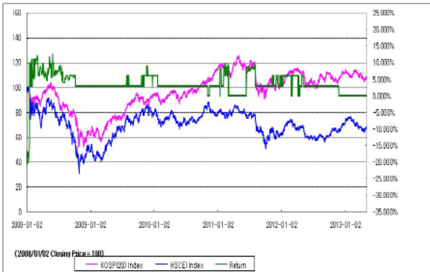
아임유 제3812회 수익률 모의테스트

주1) 위 그래프와 표는 투자시점이 2008년 01월 02일부터 2013년 05월 23일까지인 경우로 가정하여 분석한 결과입니다.