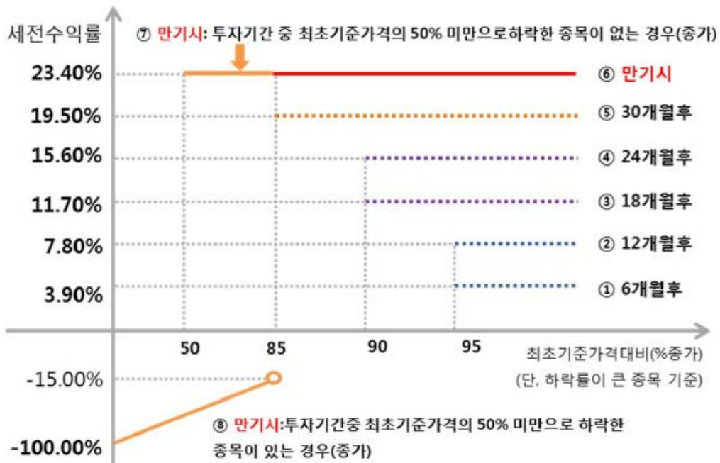
트루 파생결합증권(주가연계증권) 제9304회 (예상 손익구조 그래프)