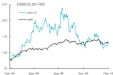
최근 12개월 상대주가 추이